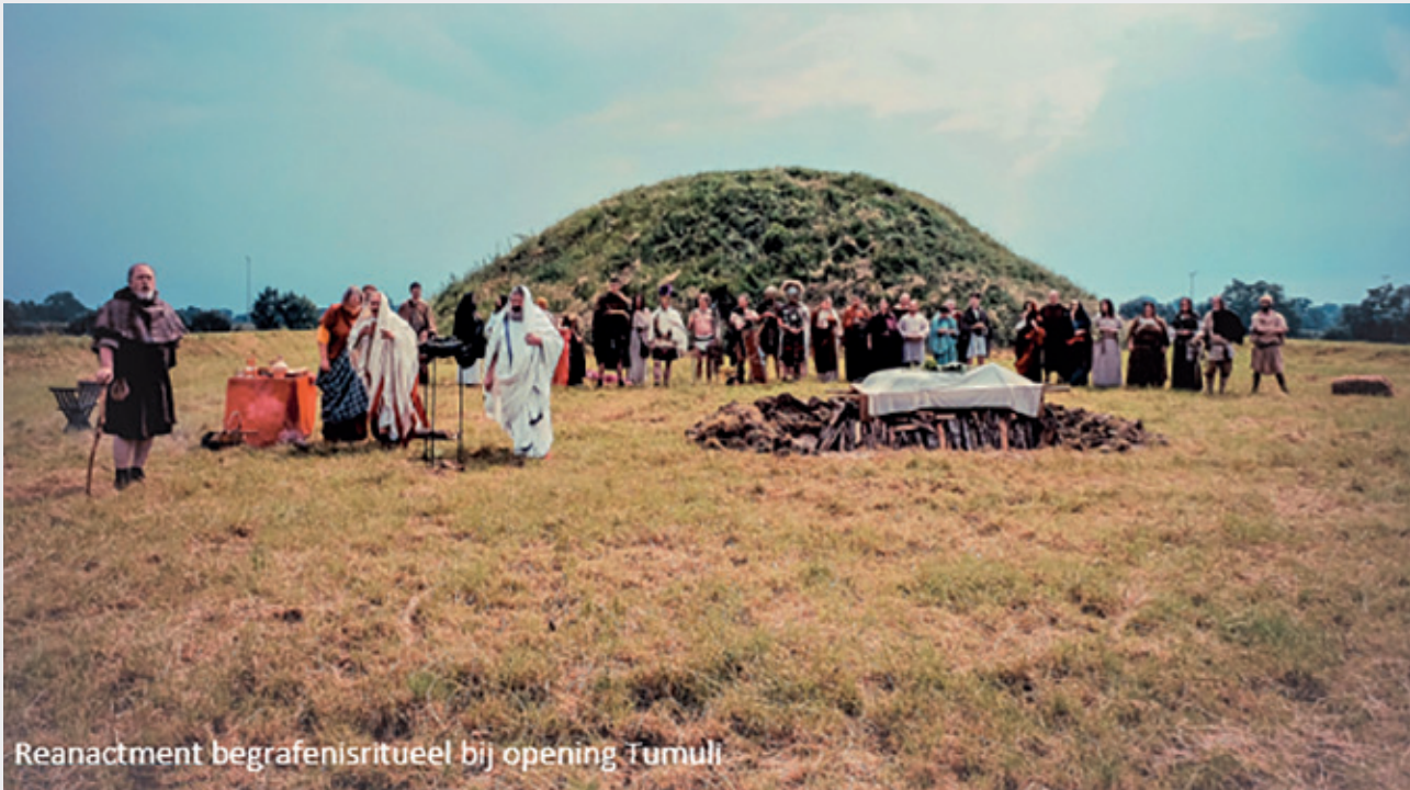
Reenactment begrafenisritueel bij opening Tumuli