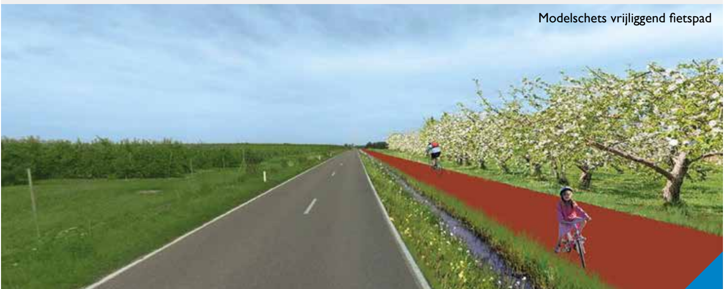
Modelschems vrijliggend fietspad

In het kader van de realisatie van het functioneel fietsroutenetwerk zal tussen Niel en Jeuk langs de Oude Katsei een vrijliggend fietspad worden aangelegd. Momenteel is de studie- en ontwerpfase bezig. Gekoppeld aan deze werken zal gelijktijdig het wegdek van de Oude Katsei tussen Jeuk en Niel vernieuwd worden. Voorziena budget voor 2022 en 2023: € 655.000.